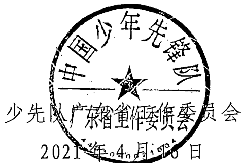
少先队广东省工作委员会