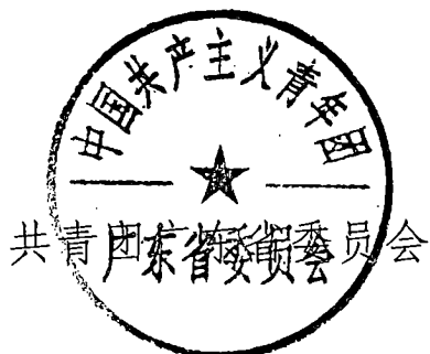
共青团广东省委员会