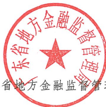
广东省地方金融监督管理局