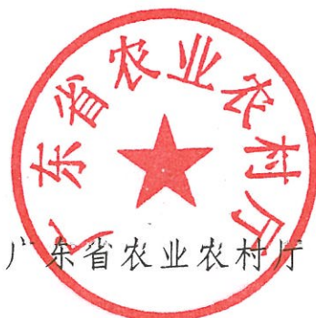
广东省农业农村厅