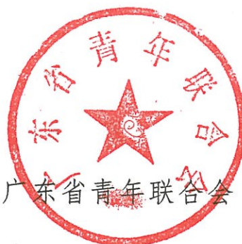
广东省青年联合会