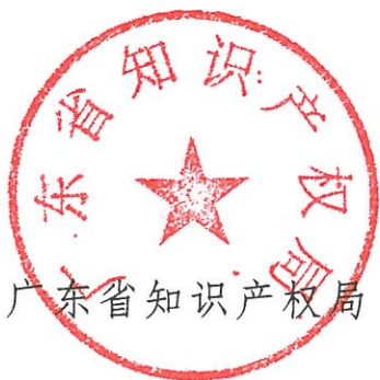
广东省知识产权局