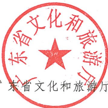
广东省文化和旅游厅